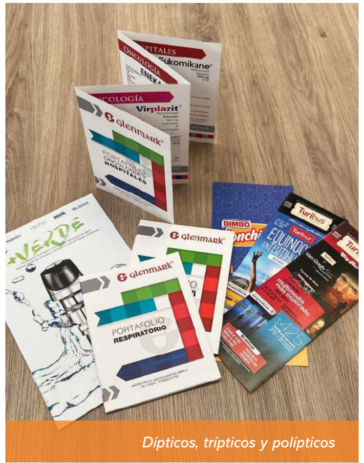
Dípticos, trípticos y polípticos