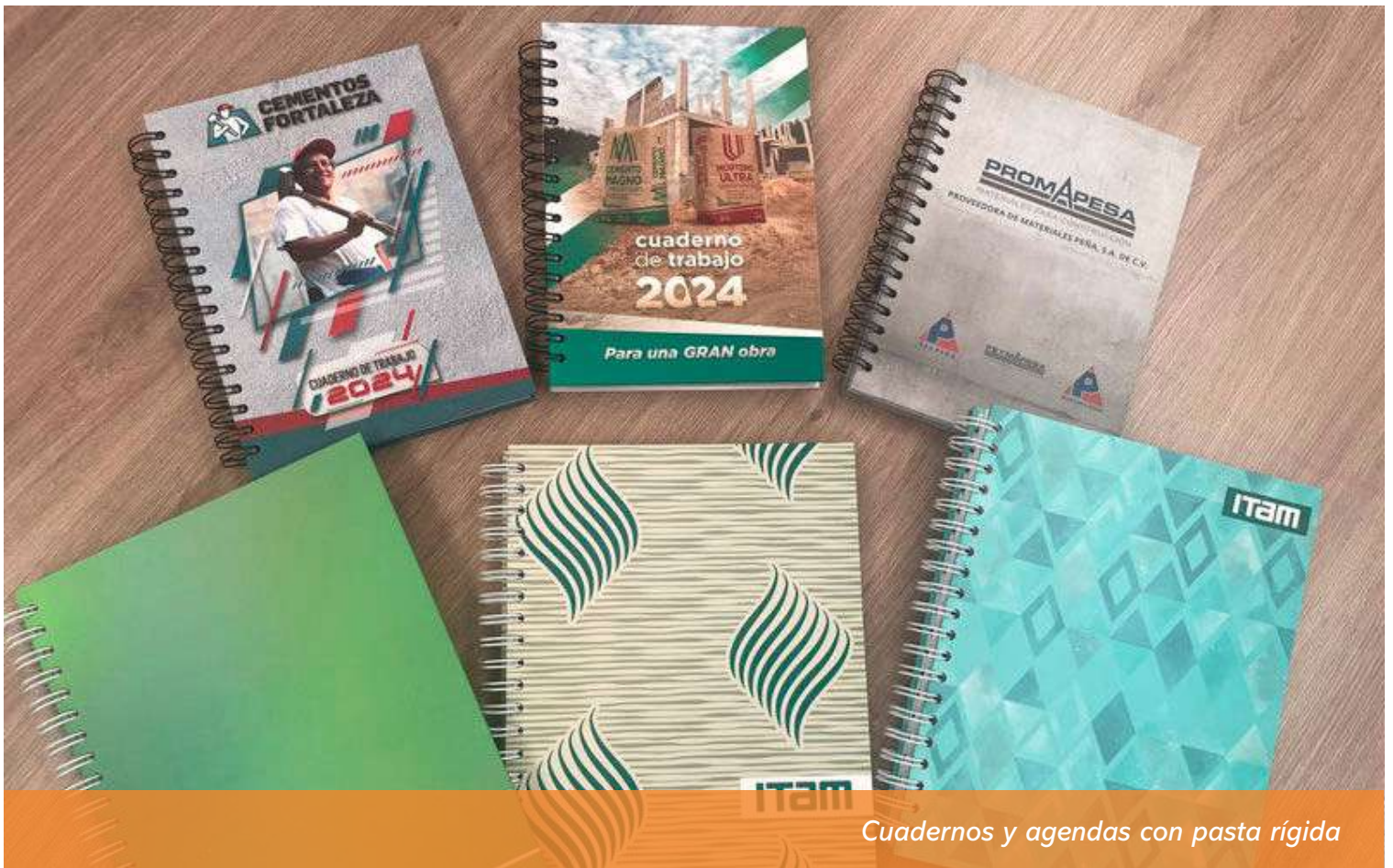
Cuadernos y agendas con pasta rígida