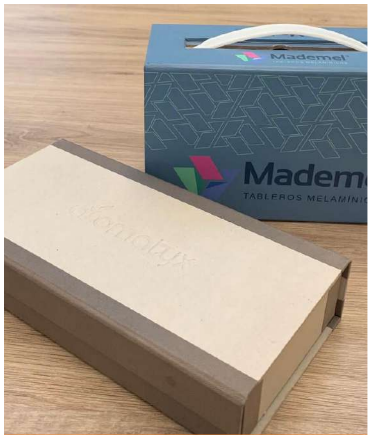
Cajas de Cartón rígido