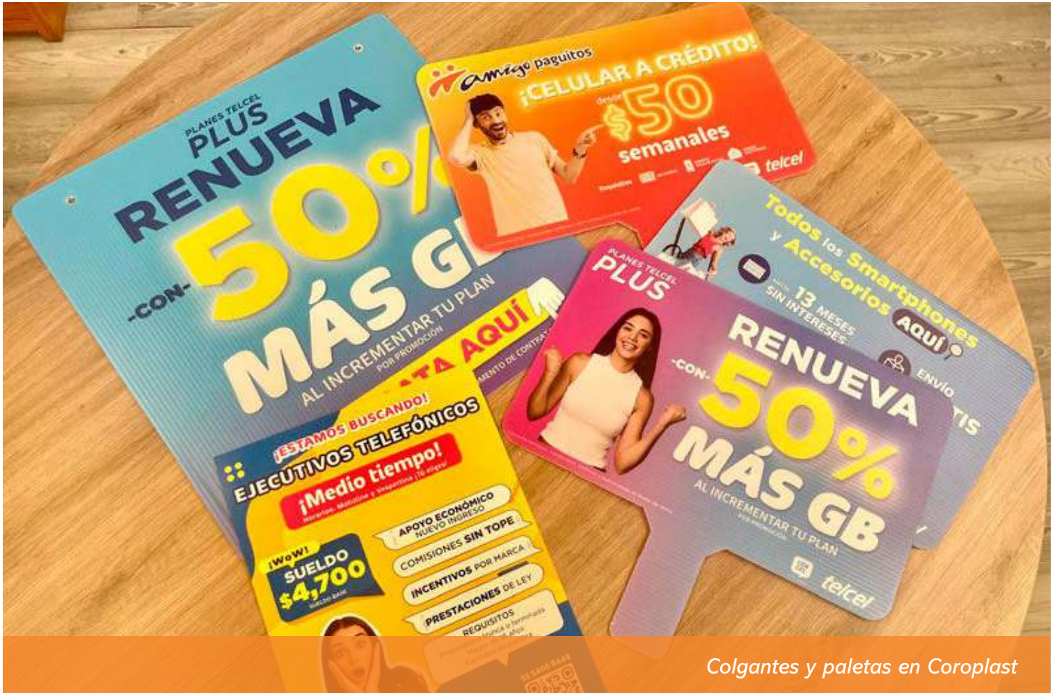
Colgantes y paletas en Coroplast