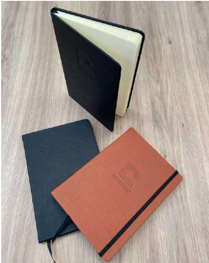
Libretas de Curpiel