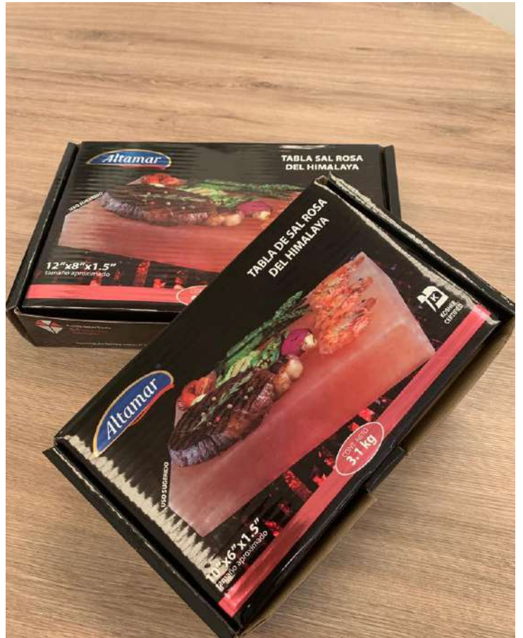
Cajas de micro corrugado