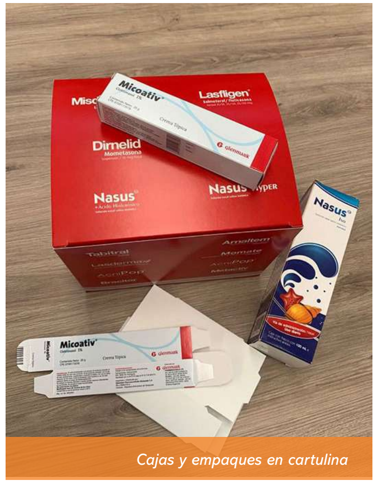
Cajas y empaques en cartulina