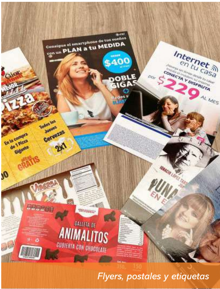
Flyers, postales y etiquetas